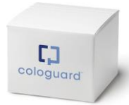
کولوگارد (در خانه (در کلینیک))