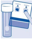
اف آی تی و اف او بی تی (درخانه)

از داکتر تان بپرسید که کدام نوع آزمایش برای شما درست است!